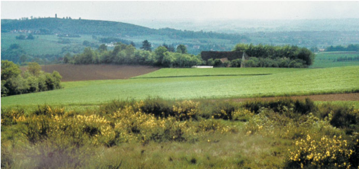
Von der Egge zum Bismarckturm: Ein Meer von gelben Blüten des Englischen Ginsters breitet sich bis in die 1960er Jahre am Sender in Schwarzenmoor aus. Der Bismarckturm überragt noch den damals jungen Wald auf dem Stuckenberg.