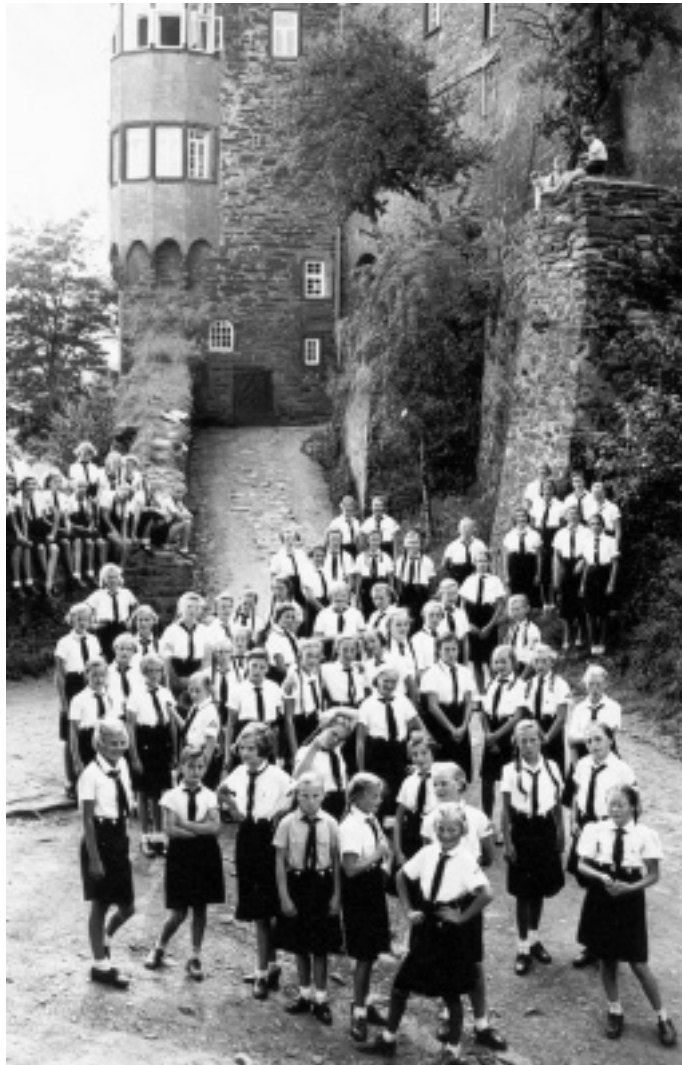
Mit der Schulklasse unterwegs: Hier sind es Mädchen des Herforder Oberlyzeums (um 1938).