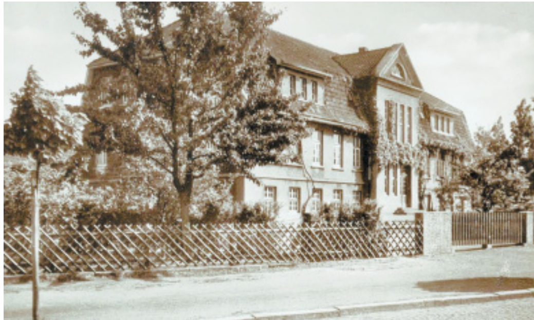
Schul-Fabrik: In der Vieringschen Zigarrenfabrik an der Löhner Königsstraße war seit 1926 die „Höhere Knaben- und Mädchenschule“ zu Hause. Hier entstand 1963 die neue Realschule.

Zu Ostern ist auf der Mühlenanlage im Löhner Mittelbachtal (Rürupsmühle) immer besonders viel los. Der Verein „Vom Korn zum Brot lädt alle Kinder zum Ostereiersuchen ein, reicht für die Erwachsenen Kaffee und Kuchen und öffnet von 11 bis 18 Uhr alle Gebäude für Besucher. – Die nächsten Vorführungen – dreschen, reinigen, mahlen, backen (und frisches Brot probieren) – finden am 5. und am 19. April jeweils von 14 bis 18 Uhr statt. Info: rührupsmuehle.de