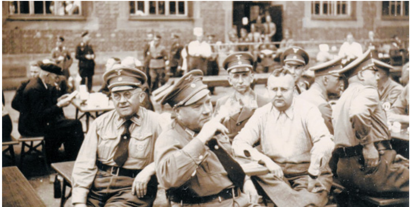
Als Hilfspolizisten erwünscht: Herforder SS-Leute (hier 1935 bei einem Parteitag in Nürnberg).

Geplant wird die Aufstellung einer Hilfspolizei in der Stärke von 100 Prozent der vorhandenen Exekutivpolizei. Es sollen zunächst sechs Gruppen von je