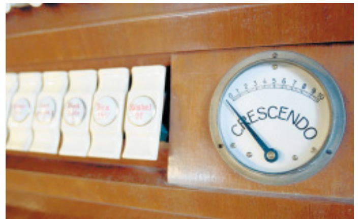
Originalzustand: Neben den Registerwippen befindet sich die Crescendo-Anzeige. Sie zeigt an, wie viele Register eingeschaltet sind.

Wie kommt's? In Herford herrscht seit reichlich 150 Jah-